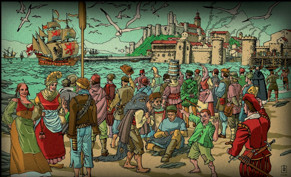
Muelles de las Naos, el Castillo del Rey, la Colegiata de los Cuerpos Santos y el Boquerón, vistos desde el playazo de la Calle de la Mar (primeros números de la actual Calle Hernán Cortés). Ilustración de Chema Román basada en el dibujo de J. Hoefnagel de 1575