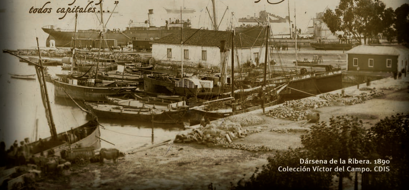
Dársena de la Ribera. 1890 Colección Víctor del Campo. CDIS

“ Agua y sal, arena y piedra, madera y hierro para recibir viajeros, para despedir a pescadores, para el tránsito de soldados y descubridores, de nobles príncipes o ciudadanos anónimos, todos protagonistas, todos capitales...”