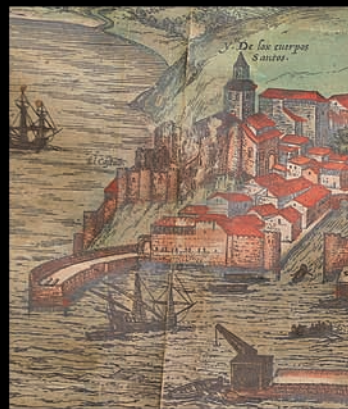
Grabado de Hoefnagel publicado por G. Braun. 1575

Se han conservado restos de lo que fue la primera estructura realizada entre los siglos XV y XVI, el muelle de las Naos. Este muelle discurría desde los pies de la Abadía de los Cuerpos Santos (actual Catedral) hacia el Este, más adelante se complementa con el muelle del Martillo, cuyo trazado sigue la misma dirección que la actual calle M. Sanz de Sautuola. De esta manera se da forma a la Dársena de La Ribera, que ya puede observarse en el grabado de Hoefnagel, publicado en 1575. Se trata de un dique cimentado sobre el lecho de margas y cayuelas de la bahía, levantado con grandes sillares de roca caliza en los lienzos externos y relleno de roca y tierra en el interior